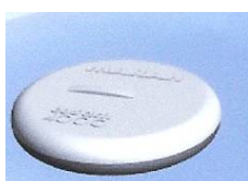
schwarz (pos.) weiss (neg.) 4000 Gauss. Für Applikationen 21 mm Durchmesser x 3 mm € 30,00/Stück