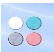
2 Biomagneten Cosam 8000 2 Biomagneten Cosam 4000 mit Gebrauchsanweisung, Notizbuch und Pflaster € 110,00

Versorgen Sie Ihren Magneten nach Gebrauch nicht zusammen mit Ihren Kreditkarten oder Floppy-disc etc., sie werden gelöscht und funktionieren nicht mehr.